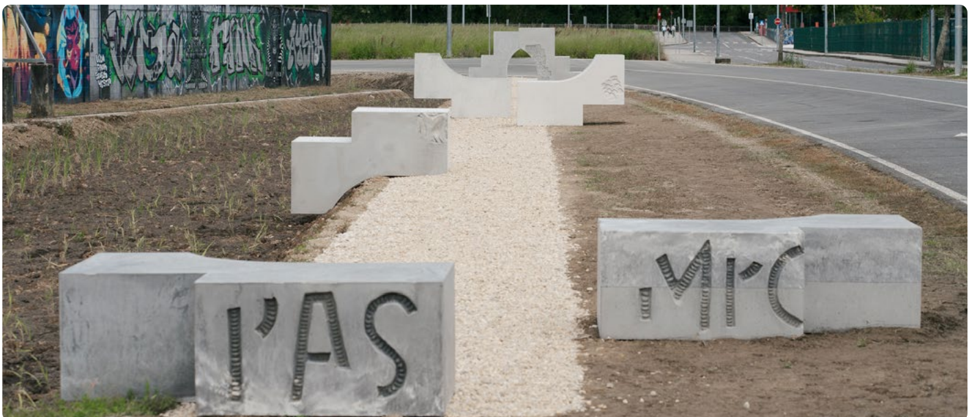
Legado Cuidado, intervención de Carme Nogueira. Betanzos (A Coruña), 2024.

Presenta tu idea mediante este formulario.