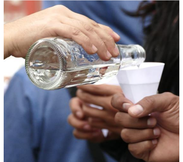
Desayuno de viernes, Food is free . Fotografía cortesía de Primal 754mm, Rainbar. Fotografía cortesía de Primal

Por su parte, Casa Río-Lab está situada en Punta Lara (provincia de Buenos Aires, Argentina), en la boca del estuario del Río de la Plata. Es una organización independiente que acerca las prácticas socialmente comprometidas a las diferentes comunidades que habitan esa enorme cuenca hidrográfica y conectan estética, activismo medioambiental y organización comunitaria. A través de los ejes transversales arte, medio ambiente, conocimiento científico, acercamiento sensible y saber local, Casa Río activa procesos de aprendizaje colectivo. Definiéndose como un centro de articulación bioregional, comparte y desarrolla acciones conjuntas con otras organizaciones de la Cuenca del Plata ante la amenaza de estos territorios frente a los conflictos ambientales y geopolíticos que afectan a la zona y el avance de los sistemas extractivos.