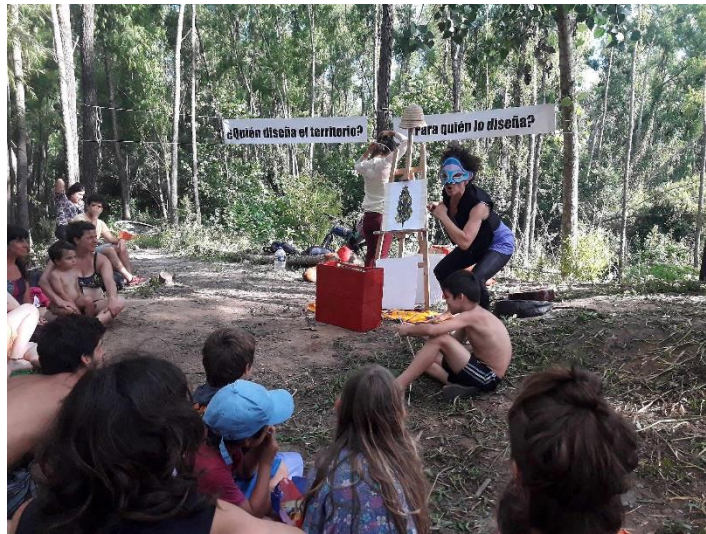
Who designs the territories And for who are they designed.

El equipo de Casa Río-Lab coproduce investigaciones que involucran a equipos multidisciplinares con profesionales de diferentes campos, artistas y habitantes de las zonas afectadas, para compartir experiencias y prácticas que generan capacidades para promover el desarrollo conjunto de las zonas en cuestión. Además, esto permite experimentar nuevas formas de pensar el territorio y diseñar las políticas públicas en la planificación de uso de las zonas costeras. Especialmente para que se consideren y se respeten los ecosistemas existentes, los usos, costumbres y deseos de las comunidades que las habitan.