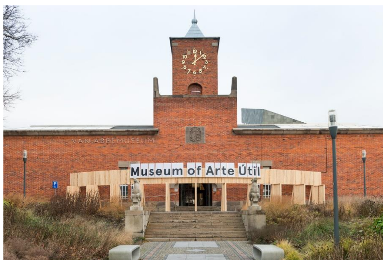
Museo de Arte Útil (07/12/2013 - 30/03/2014), Van Abbemuseum, Eindhoven (Países Bajos).

El archivo fue inicialmente compilado para ser la piedra angular de la exposición “El Museo de Arte Útil” en 2013 (Van Abbemuseum, Eindhoven, Países Bajos) y como herramienta que abre paso a una historia del arte paralela, trazando el recorrido de estas prácticas como movimiento artístico a través de la historia. Con ello se continuaba con la investigación que la artista Tania Bruguera había desarrollado durante una década en torno al concepto de Arte Útil.