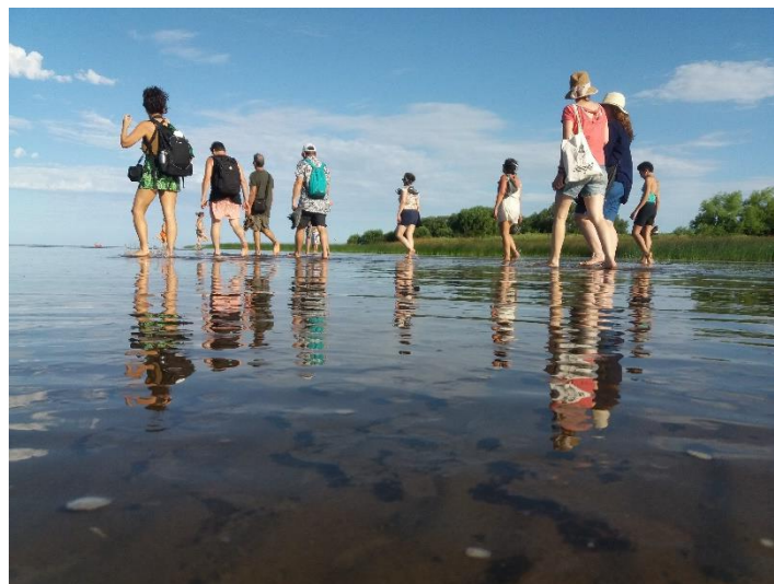
Moisture gives life .

Por su parte, Casa Río-Lab está situada en Punta Lara (provincia de Buenos Aires, Argentina), en la boca del estuario del Río de la Plata. Es una organización independiente que acerca las prácticas socialmente comprometidas a las diferentes comunidades que habitan esa enorme cuenca hidrográfica y conectan estética, activismo medioambiental y organización comunitaria. A través de los ejes transversales arte, medio ambiente, conocimiento científico, acercamiento sensible y saber local, Casa Río activa procesos de aprendizaje colectivo. Definiéndose como un centro de articulación bioregional, comparte y desarrolla acciones conjuntas con otras organizaciones de la Cuenca del Plata ante la amenaza de estos territorios frente a los conflictos ambientales y geopolíticos que afectan a la zona y el avance de los sistemas extractivos.