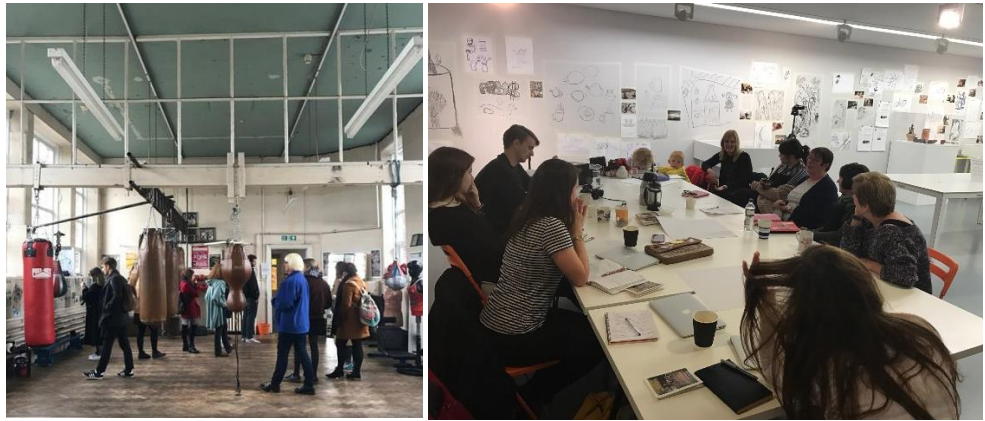
Broadcasting the archive #9 , mima, Middlesbrough. Visita a iniciativas locales, North Ormesby. Broadcasting the archive #9 , Middlesbrough. mima, 2016.

Esta investigación se articuló colectiva a través de un proceso continuo de debate y cuestionamiento entre la artista, varios museos, un equipo de investigadores del que formé parte, un “comité de expertos” (artistas, comisarios y teóricos vinculados a estas prácticas desde diferentes continentes) y una convocatoria internacional de proyectos. Partíamos del deseo conjunto de interrogar el papel del arte y de las instituciones artísticas en el siglo XXI, reflexionar sobre la condición de autor y de espectador, así como lograr espacio de análisis para evidenciar la capacidad del arte de afectar y transformar la realidad que nos rodea.